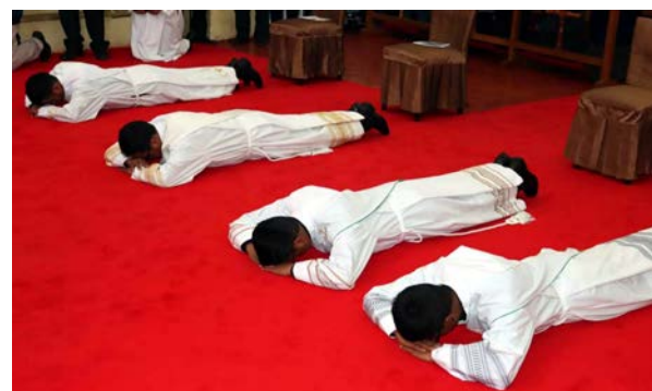
Von Ursula Wiedemann

Im vergangenen Jahr hatte die Diözese Sicuani die große Freude, vier junge Männer zum Priester weihen zu können.