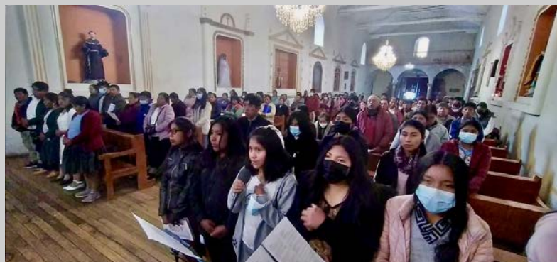
Von Ursula Wiedemann

2019 wurde nach einem 10 monatigen Prozess von allen pastoralen Mitarbeitern, Priestern, Ordensfrauen und Laien der neue Pastoralplan der Diözese Sicuani erstellt. Wir berichteten darüber ausführlich in einem Sonderheft.