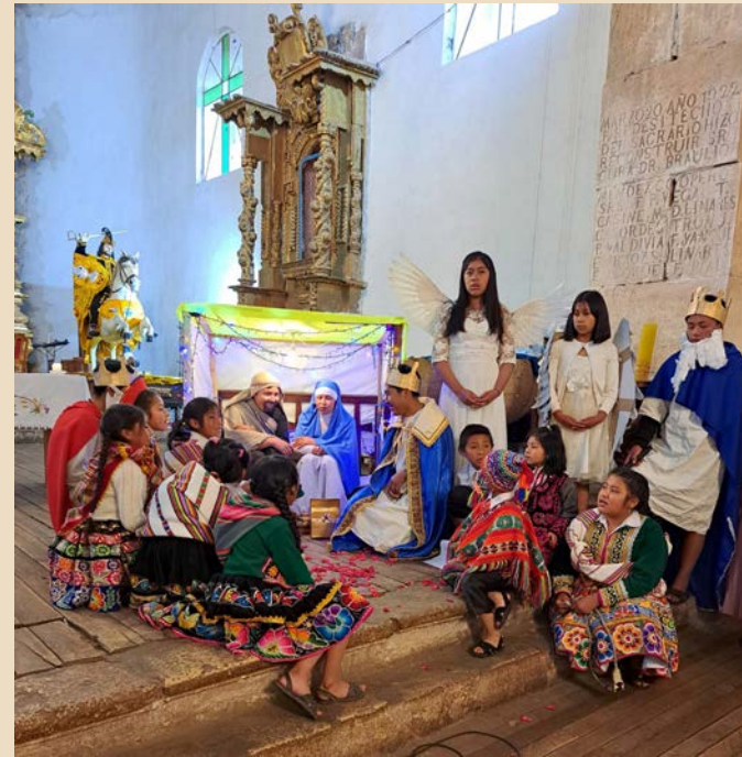
Von Ursula Wiedemann