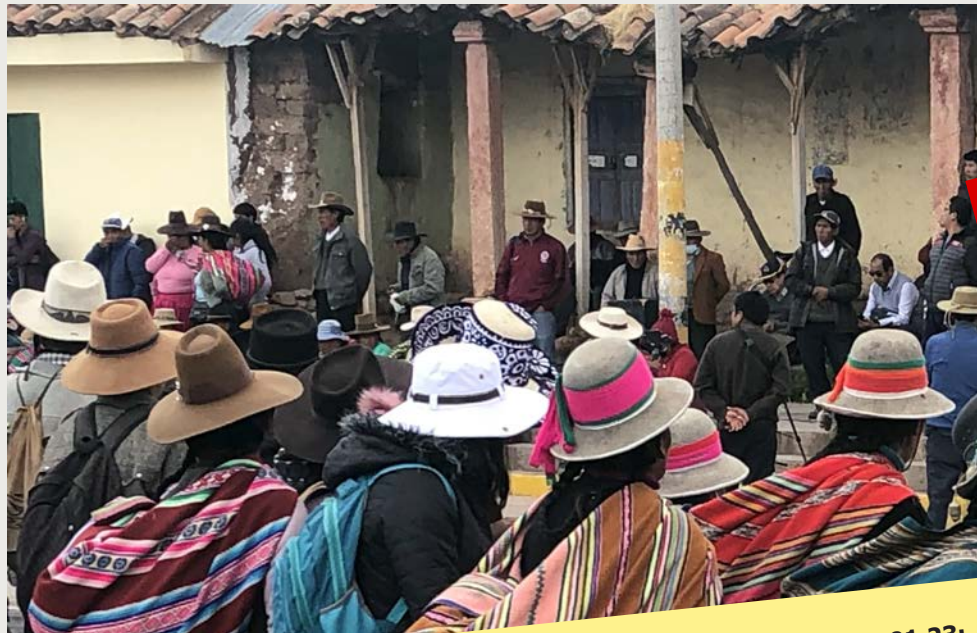
Von Ursula Wiedemann