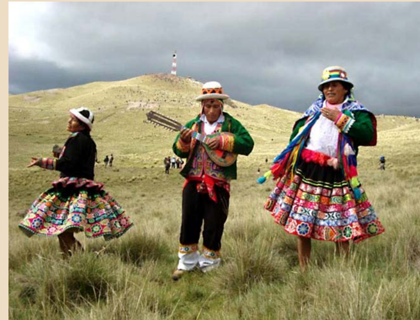
Von Bruno Baur