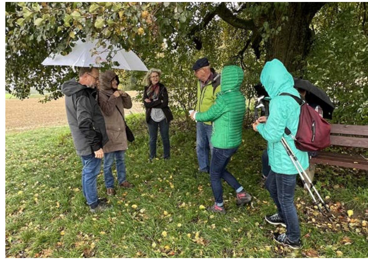
Von Monika Fodi

Am 15. Oktober 22 war unser traditioneller Wandertag des Perukreises und Weltladenteams angesagt. Leider sah das Wetter an diesem Samstag morgen gar nicht gut aus und einige stellten sich bereits die Frage, ob die Wanderung überhaupt stattfinden kann.