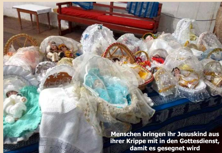
Menschen bringen ihr Jesuskind aus ihrer Krippe mit in den Gottesdienst, damit es gesegnet wird